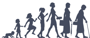
Subventions aux collectivités amies des aînés

La vaste gamme de mesures de soutien (p. ex. programmes, avantages sociaux, lois) qui protègent les gens pendant différents changements de vie qui peuvent avoir une influence sur la santé et la qualité de vie.