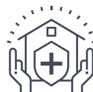
Programmes de soins à domicile

De quelle façon la politique sociale a-t-elle un impact sur la prévention des blessures? Voici un exemple: