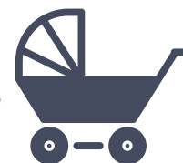
Allocation pour enfants et subvention pour les frais de garde d'enfants