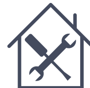
Programmes de rénovation

Quelles politiques sociales existent au Canada?