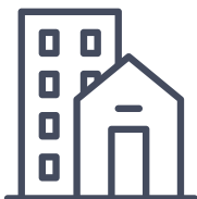
Programmes de logements familiaux