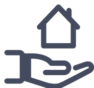
Remboursement de l'impôt foncier

Quelles politiques sociales existent au Canada?